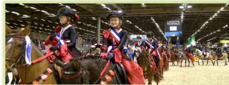
Champion de France des Carrousels