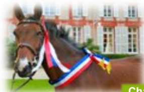
Champion de France CSO Vétéran