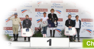
Champion de France CSO Cadet