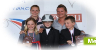
Médaille de bronze CSO shetlands