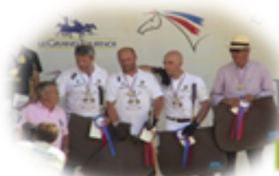
Vice Champion de France polo